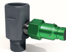
NÉCESSAIRE D'ADAPTATEURS DE BOÎTE D'ENGRENAGES

Les kits d'adaptateurs sont disponibles en couleur gris foncé et configurés avec des raccords rapides colorés* et sont disponibles en 10 couleurs Oil Safe familières ou argent, sans raccords rapides ou raccords rapides Iso-b.